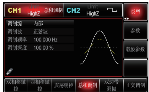
多种调制功能: 总和调制