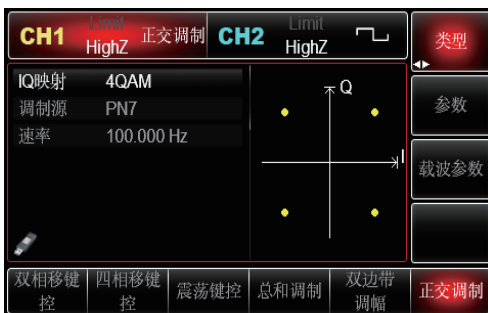
多种调制功能: 正交调制